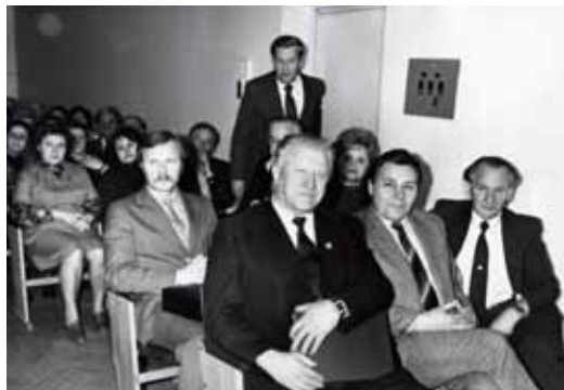
Собрание в конференц-зале.