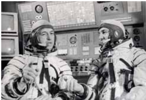
Космонавты Севастьянов В.И., Климук П.И. до полета на ОК «Союз-18»–«Салют-4».