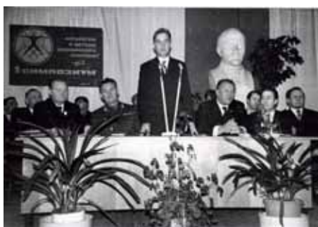
Президиум заседания Первого симпозиума по аппаратуре и методам медицинского контроля (Биофизприбор, Ленинград).