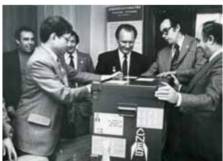
Знакомство с французским оборудованием для совместных экспериментов (г. Дубна).