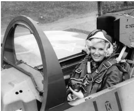
Врач-космонавт Доброквашина Е.И. во время подготовки к космическому полету.