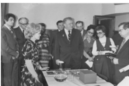
Делегация стран-участниц программы «Интеркосмос» в ИМБП.