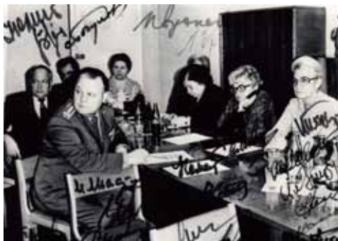
Заседание Главной медицинской комиссии.