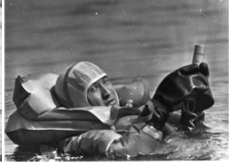
Космонавт Гуррагча Ж. (МНР) на тренировке