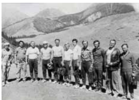
Учебно-тренировочные сборы космонавтов и кандидатов в космонавты в условиях среднегорья (Киргизская ССР, горы Тянь-Шань).