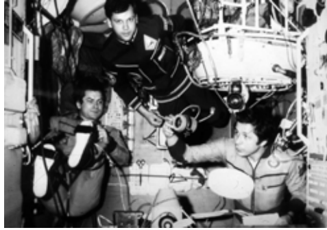
Физическая тренировка на борту ОС «Салют-6»: Коваленок В.В., Савиных В.П. (ОЭ) и космонавт СРР Прунариу Д. – экспедиция посещения.