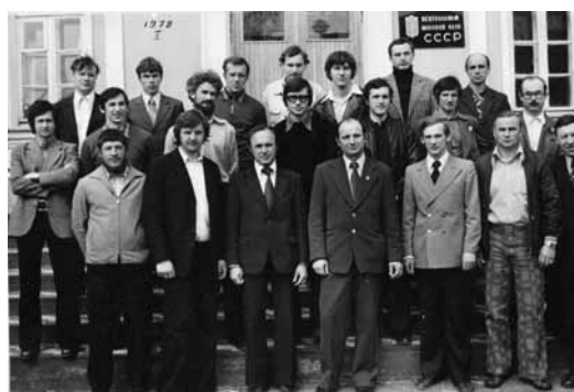
Первые шаги в направлении подводных исследований: семь сотрудников ИМБП направлены в водолазную школу.