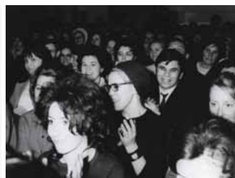
Концерт Высоцкого В.С. в конференц-зале ИМБП.