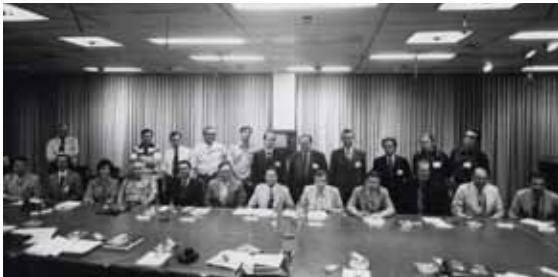
На совещании совместной советско-американской рабочей группы по космической биологии и медицине в НАСА.