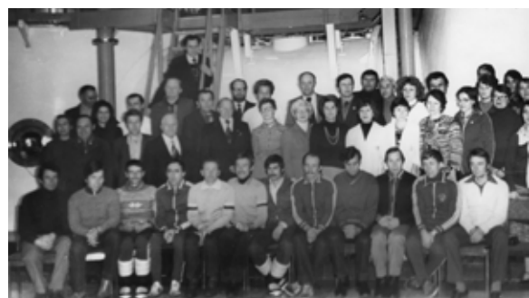
Альпинисты, участники Гималайской экспедиции.