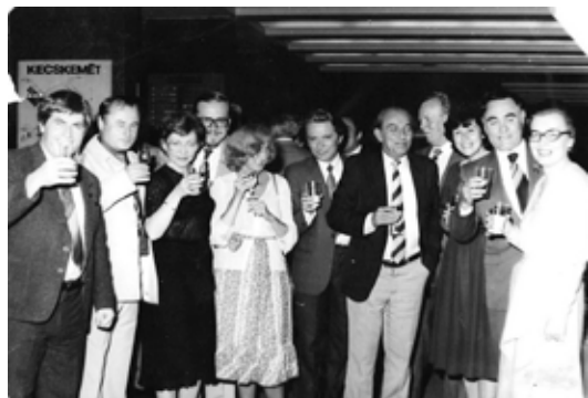
Совещание по программе «Интеркосмос». (Венгрия, г. Кечкемет).