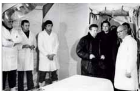
Демонстрация медико-эвакуационного комплекса для оказания медицинской помощи в экстремальных условиях министру здравоохранения Чазову Е.И.