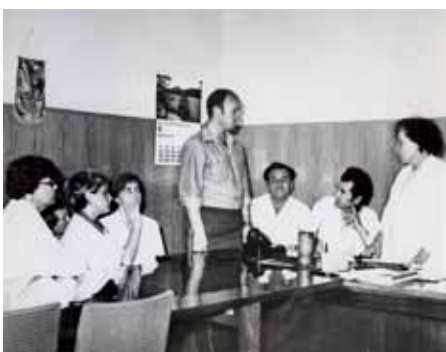
Заседание ВЭК. Космонавт Лебедев В.В. на очередном годовом переосвидетельствовании.