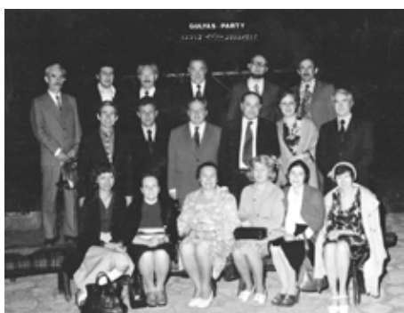
Специалисты ИМБП и Института биофизики на совещании рабочей группы по программе «Интеркосмос» (г. Будапешт).