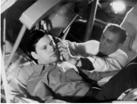
Космонавт Прунариу Д. (СРР) на тренировке в ЦПК.