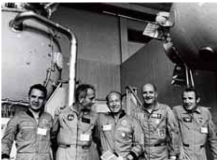
Экипаж первого совместного СССР/США полета («Союз»–«Аполлон»).