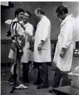
Космонавт Савиных В.П. на медицинском обследовании перед первым полетом в космос (Байконур).