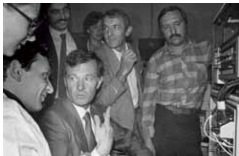
Подготовка космонавта Франции Кретьена Ж.-Л. к полету.