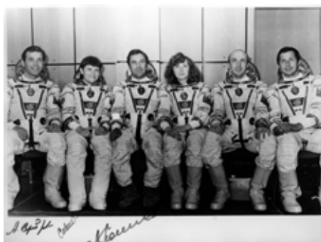
Космонавты и кандидаты в космонавты отрядов ЦПК ВВС и РКК «Энергия».