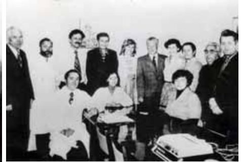
Терешкова В.В. (четвертая справа) с сотрудниками ИМБП в период прохождения медицинского обследования.