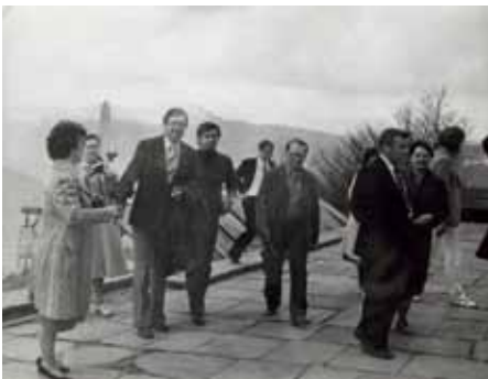
Научные туристы – участники XIV совещания по программе «Интеркосмос» – на Шипке.