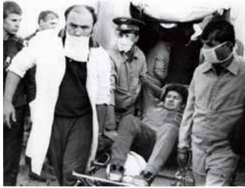
Рюмин В.В. после 175-суточного полета на ОС «Салют-6».