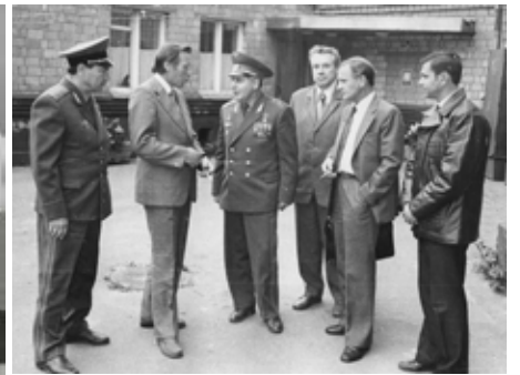
Космонавт Титов Г.С. и сопровождающие лица в ИМБП.