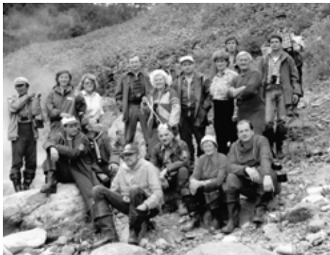
Учебно-тренировочные сборы в Кроноцком заповеднике (Камчатка).