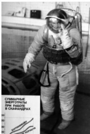
Рюмин В.В. в скафандре для выхода в открытый космос. График энергозатрат экипажа «Союз-35» – «Салют-6» в период 3-часовой работы в скафандре в открытом космосе.