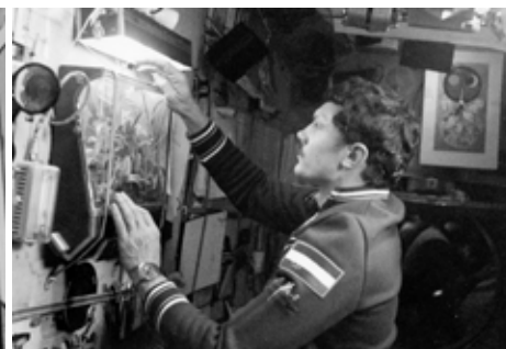
Космонавт ВНР Фаркаш Б. проводит эксперимент на установке «Малахит».