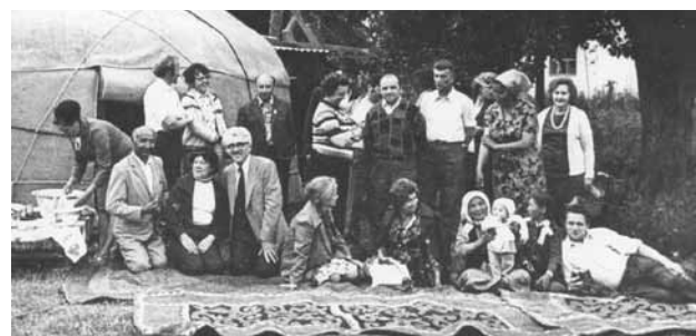
Члены Научного совета по проблемам радиобиологии АН СССР, коллеги из Киргизии и сотрудники ИМБП в Казахстане.