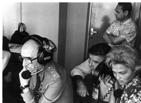
Переговоры Газенко О.Г. с космическим экипажем «Союз-35» – «Салют-6» Поповым Л.И. и Рюминым В.В. Прямая связь с Большой спортивной арены (стадион Лужники) во время Олимпиады-80.