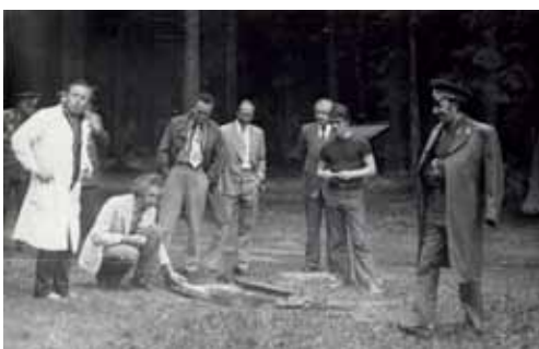
Испытания и оценка медико-эвакуационного комплекса, предназначенного для обследования человека и животных (санаторий «Истра»).