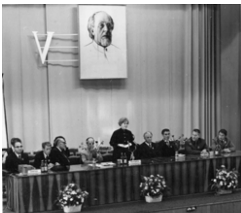
V Всесоюзная конференция по космической биологии и медицине (г. Калуга).