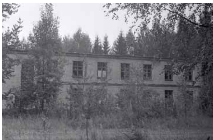
Лаборатория радиобиологии многозарядных ионов (г. Дубна)