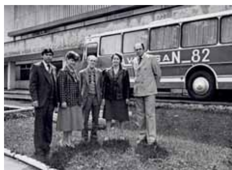
Передвижная лаборатория "Автосан" для экспресс-оценки состояния здоровья (г. Калуга).