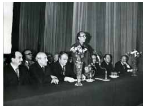
Президиум первых чтений, посвященных памяти академика Парина В.В., в Доме ученых (г. Москва).