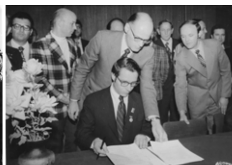
Подписание протокола на 9-м Совещании советско-американской рабочей группы по космической биологии и медицине (г. Ленинград).