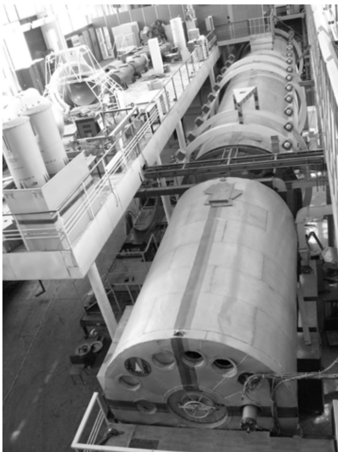
Наземный экспериментальный комплекс (НЭК)