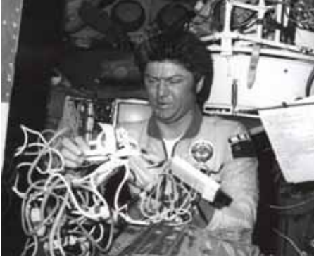
Космонавт Рюмин В.В. готовится к проведению медицинских экспериментов.