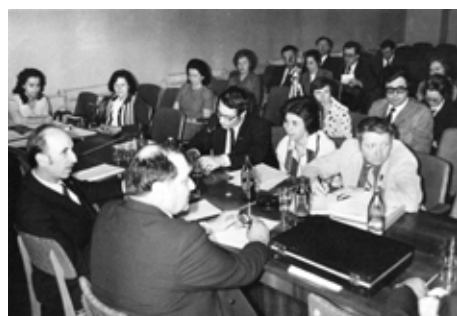
Президиум и участники международной конференции по обсуждению результатов совместных биологических экспериментов на ИСЗ «Космос-782» (г. Москва).