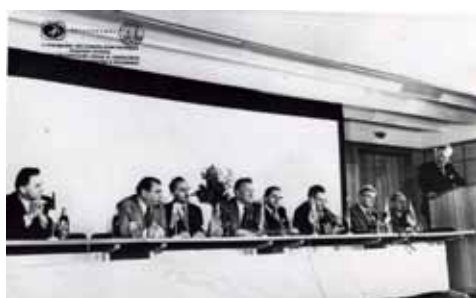
Президиум X совещания Постоянно действующей рабочей группы социалистических стран программы «Интеркосмос» по космической биологии и медицине (г. Сухуми).