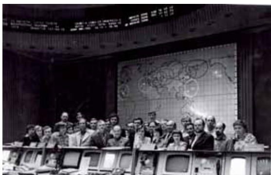
В Центре управления полетами (г. Королев).