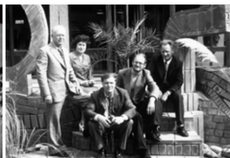
Участники советско-французской рабочей встречи (Корсика).