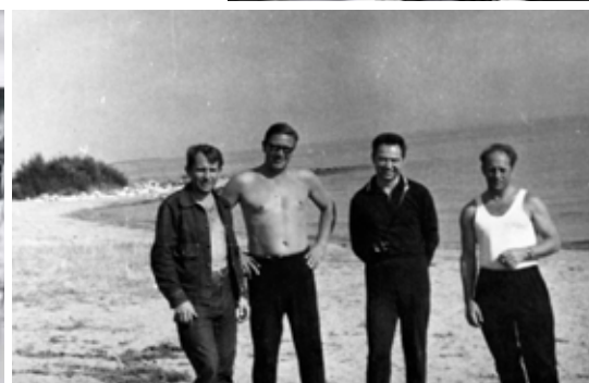
Участники учебно-тренировочных сборов на озере Иссyk-Куль.