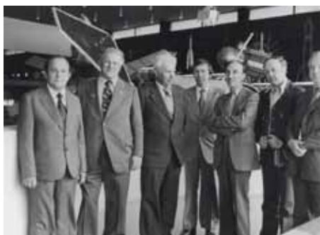
Участники 6-й Всесоюзной конференции по космической биологии и медицине в Государственном музее истории космонавтики им. Циолковского К.Э. (г. Калуга).