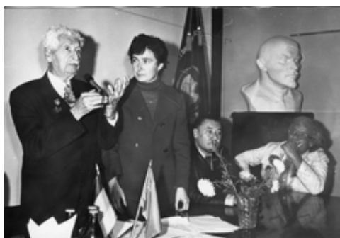
Один из пионеров ракетной техники и космонавтики Оберт Г. (США) на Ученом совете в ИМБП.