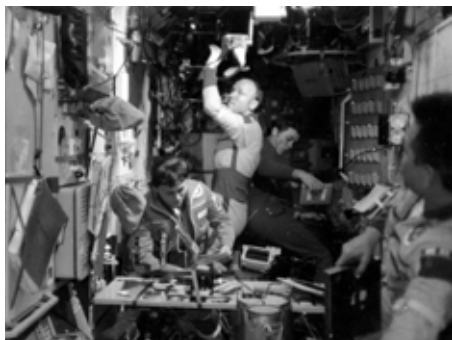
Экипаж основной экспедиции ОС «Салют-7» Березовой А.Н. и Лебедев В.В. (211-суточный полет) с членами экипажа экспедиции посещения Савицкой С.Е. (первый полет) и Серебровым А.А.