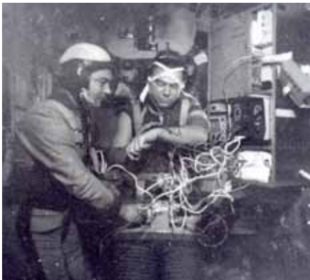
Экипаж ОК «Союз-26» – «Салют-6» Романенко Ю.В. и Гречко Г.М. во время 96-суточного полета.